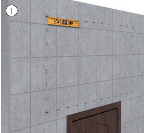
1 Ausmessen und anzeichnen des Montageortes. Measure and mark the installation site.