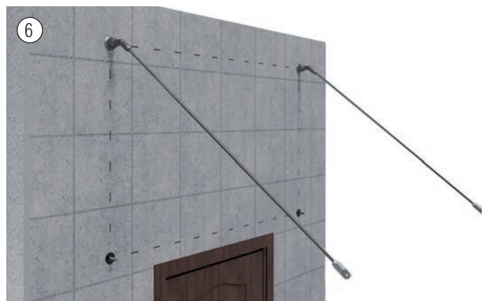
6 Anbringen der Zugstangen inkl. Zugstangenanschluß vom vorderen Halter! Tension rod installation incl. tension rod connector from the front holder!