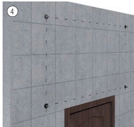
4 Einbau der Maueranker. Installation of the wall anchors.