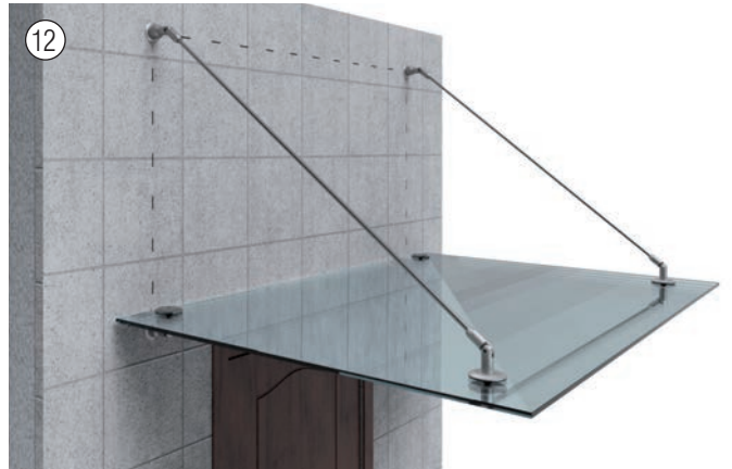
Fertig montiertes Vordach. Installed canopy.

Bei Fragen zur Vordachmontage, zu anderen Produkten oder sonstigen Informationen, stehen wir gerne zur Verfügung. If you have questions about the assembly instruction, to other products, or if you wish to receive further information, please do not hesitate to contact us.