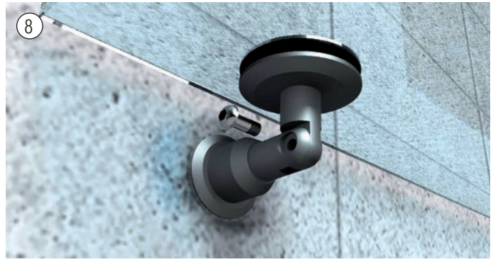
Verbinden der hinteren Wandhalterung mit dem Glasvordach. Connect the back wall mount with the glass canopy.