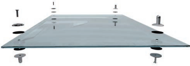
Montage der vorderen und hinteren Halterungen am Glas. Installation of the front and back holders at glass.