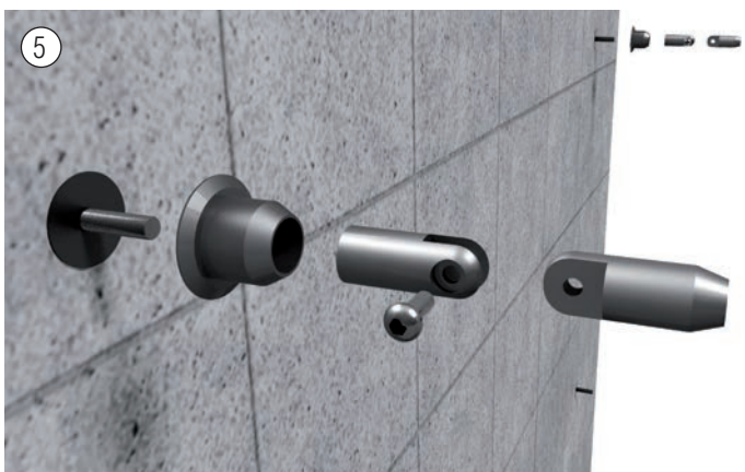
5 Zusammenbau der oberen Halterung. Assembly of the upper holder.