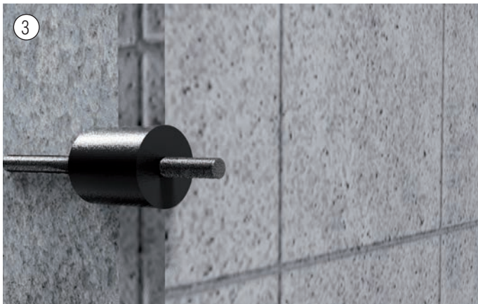
3 Einsetzen des KDS-Rohres und des Mauerankers. Insert the KDS-Rohr and the wall anchor.