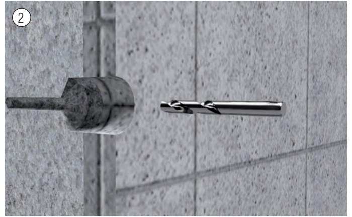
2 Bohrung für M12 Maueranker. Vollwärmeschutz Fassadendruckstabil überbrücken. Drill for M12 wall anchor. Bridge the full heating insulation stable.