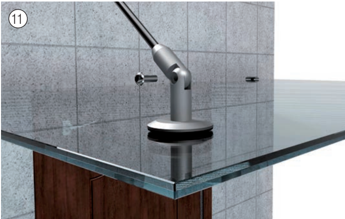
Verbinden der Glashalterung mit der Zugstange. Connect the glass holder with the tension rod.