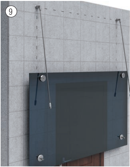
Vormontierte Zugstangen und hängendes Glasteil. Pre-assembled tension rod and hanging glass.