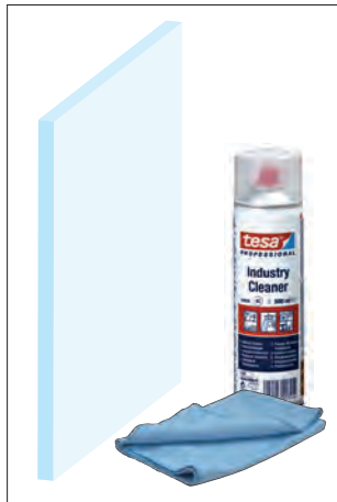
Reinigen der Glaskanten (z.B. Art. Nr. T-REINIGER) Clean the edges (e.g. Art. no. T-REINIGER)